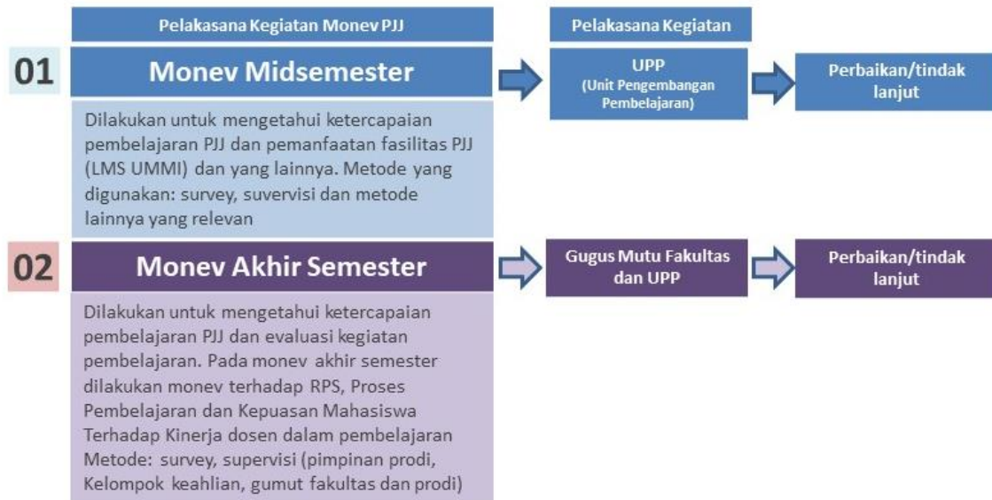
Gambar 2. Pelaksanaan Kegiatan Monev Pembelajaran

Berdasarkan temuan pada hasil monitoring dilakukan evaluasi dan tindak lanjut dalam rangka perbaikan layanan kualitas pendidikan. Hasil evaluasi di tingkat program studi dilaporkan kepada Fakultas untuk kemudian diteruskan ke tingkat universitas melalui Wakil Rektor 1 sebagai bahan informasi dan masukan terhadap pengambilan keputusan berkaitan dengan perlu atau tidaknya inovasi dan revisi dalam kegiatan pembelajaran, sehingga diperoleh informasi sebagai bahan kajian untuk perbaikan layanan akademik terhadap mahasiswa.